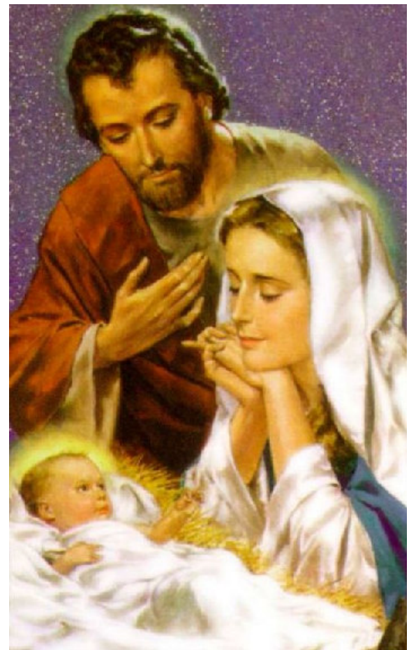
Gebet für die Familie Inniges Gebet der Befreiung und des Schutzes